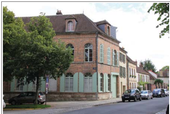
Rue du Capitaine Faucon