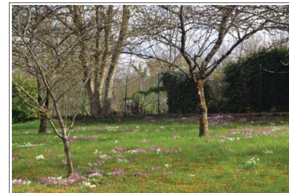
Vergers sur les hauteurs de Sézanne

Office de Tourisme de Sézanne et sa Région