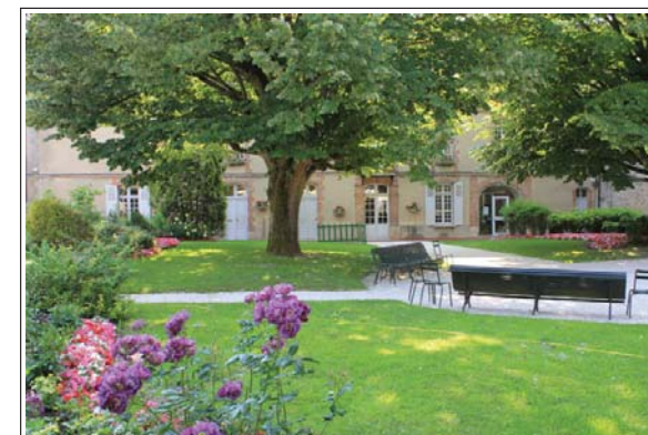
Jardin de l'Hôtel de Ville