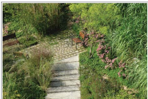
Jardin de l'Ancien Collège