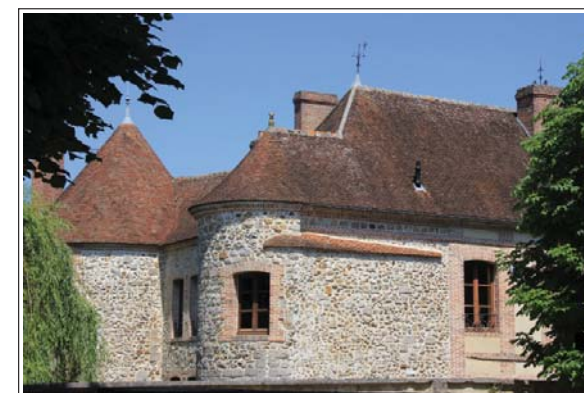
Vestige de la porte du Pied de Cane