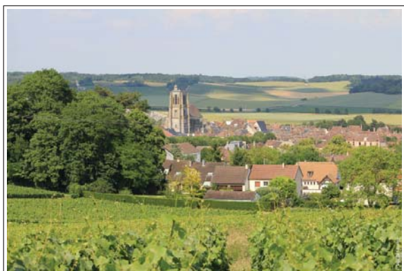
Panorama sur Sézanne