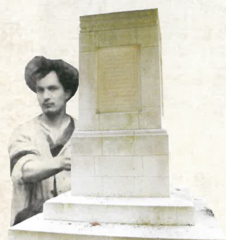
Monument A. Bourdelle