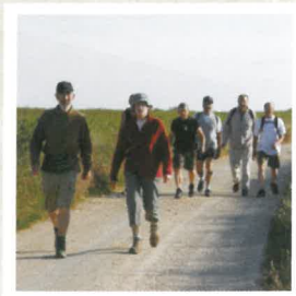
Randonnées pédestres et visites du village