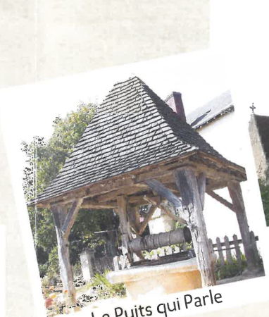
Le Puits qui Parle