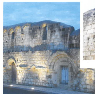
La Maladrerie Sainte-Catherine