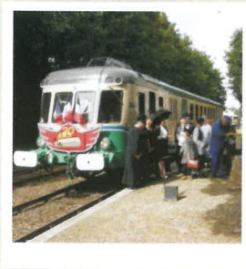
Train Touristique de la Vallée du Loir - www.ttvf.fr

Maison de campagne - chambres d'amis Route Départementale 917 + 33 (0)6 60 48 54 92