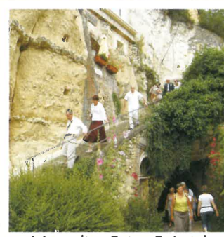
L'escalier Saint Gabriel