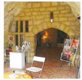
Expositions de peintures, de sculptures et d'artisanat