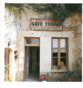
Visite de la Cave Yuccas Contact : 02 54 85 30 45