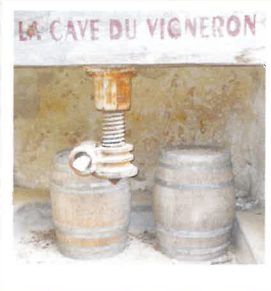
Dégustation et vente de vins locaux et produits du terroir