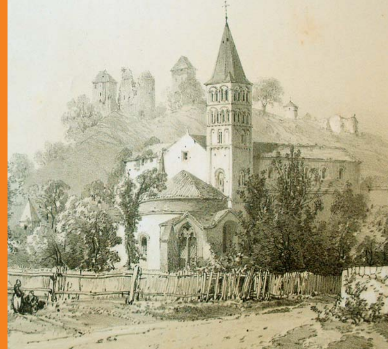
Gravure du XIX ème siècle

C'est à la mort de Gautier II en 1261, que la famille de Vignory s'éteignit. Après être passée entre les mains