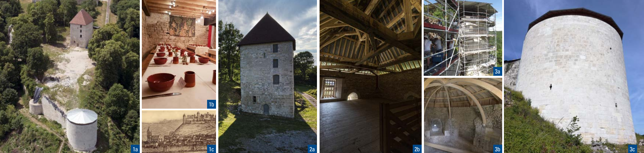
1a. Vue aérienne de l'ancienne haute-cour / 1b. Intérieur du donjon / 1c. Gravure de 1669