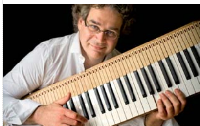
Pascal Amoyel