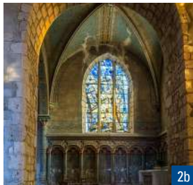
1. La porte Rouge / 2a. Toiture de l'église restaurée en 2024 / 2b. Un vitrail de l'église Saint-Etienne