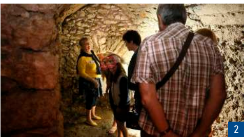
1a. L'église / 1b. Un marmouset / 1c. Inscription cachée / 2. La grotte de saint Déodat.