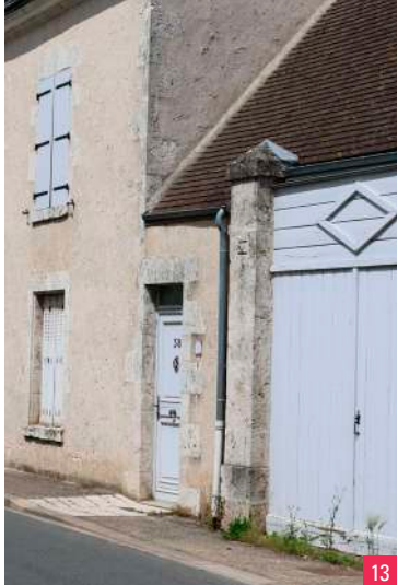
12. L'ancienne vinaigrerie / 13. La Maison des Trois Marchands, située à l'angle de la rue Nationale et de la rue de la Prez