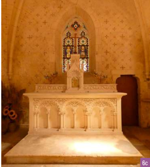
6a. L'église Saint-Julien / 6b. Tête, peut-être celle d'un moine / 6c. Autel du XIX e siècle, installé dans le chœur