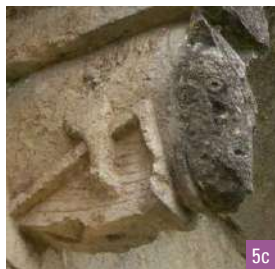
5a. L'ancienne chapelle du prieuré clunisien / 5b. La façade ouest de la chapelle / 5c. Détail d'un modillon, l'âne musicien