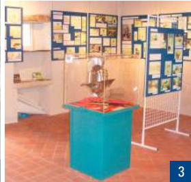
1. Les vestiges du théâtre / 2. Au premier plan, le mur de podium / 3. Salle d'exposition près du théâtre antique