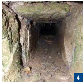
3b. L'emplacement du sanctuaire, vue du ciel / 3c. Tête d'une statue d'adolescent / 4. Aqueduc souterrain

Au I er siècle, il se compose d'une enceinte simple avec un temple ( fanum ) en position excentrée. Aujourd'hui des haies matérialisent les contours de ce temple. Il est constitué d'une cella centrale ceinturée par une galerie servant de déambulatoire aux pèlerins. Seuls les « prêtres » pénètrent dans le fanum . Les rites cultuels ont lieu à l'extérieur. Après une destruction par incendie vers 80, l'édifice est rebâti et partiellement agrandi.